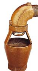
Pour soupapes taraudées 1/2"-3/4"-1"

Il permet de diriger le fluide vers l'égout ou vers un bac de rétention.