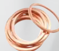
10 rondelles antiblocage.