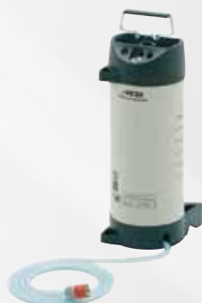
Pompe à eau manuelle Réf. 050149