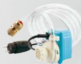
Pompe à eau électrique Réf. 050055