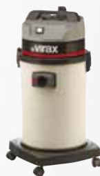
Aspirateur eau et poussières Réf. 050057