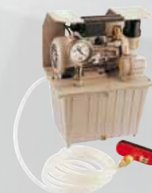
Pompe à vide Réf. 050043