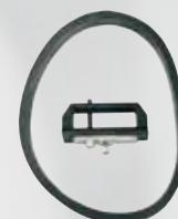
Obturbateur et joint bâti.