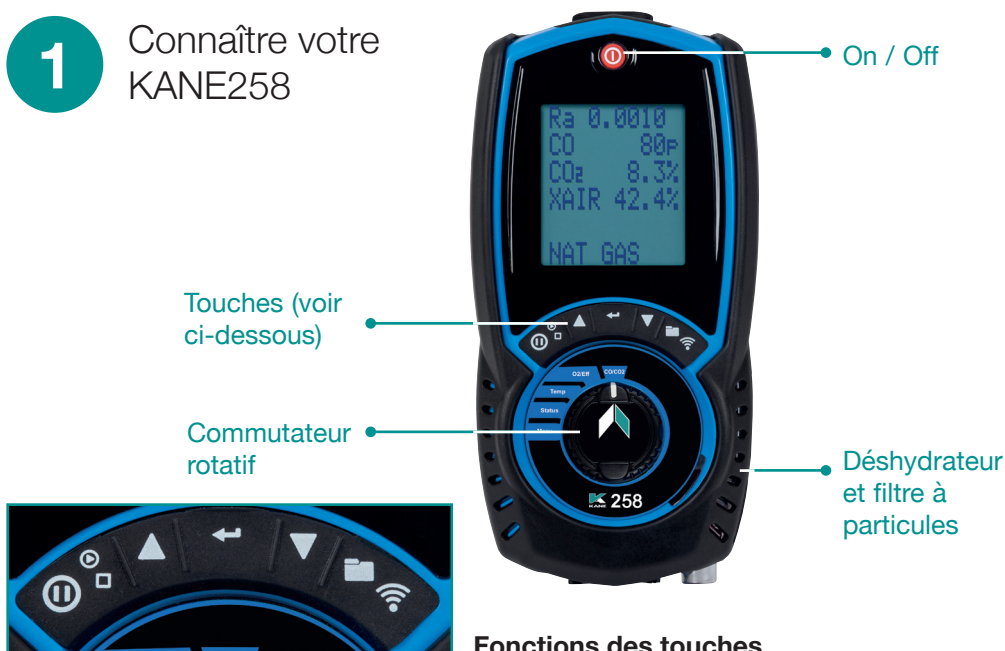
Fonctions des touches