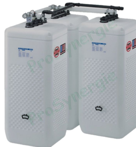
Figure 4 : accouplement de cuves