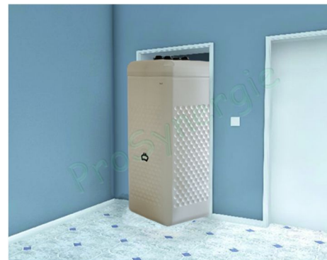
Figure 3 : Passage de porte