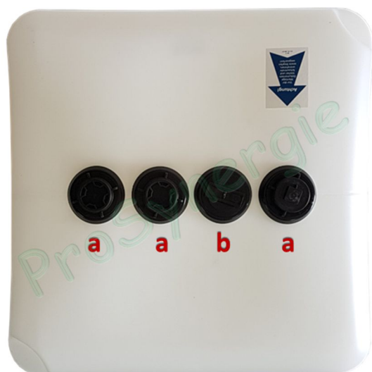
Figure 1: Piquages et bouchons