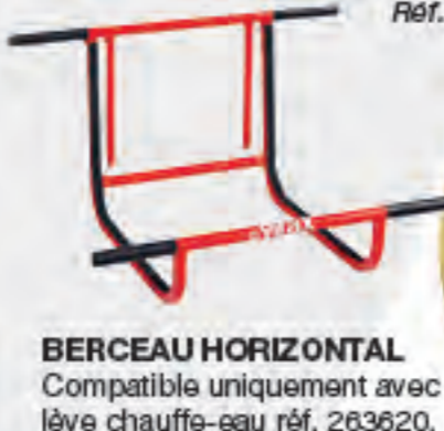
BERCEAU HORIZONTAL Compatible uniquement avec lève chauffe-eau réf. 263620.